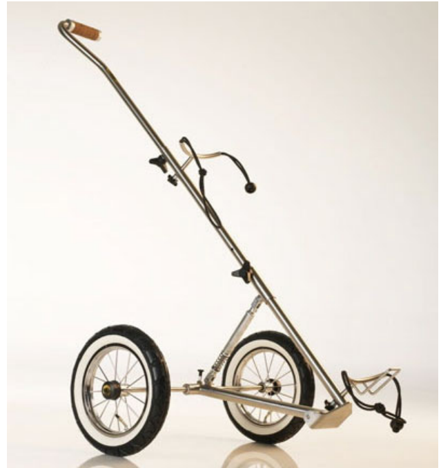
Abb. zeigt Sonderausstattung Ledergriff

Griffstange: den Führunggriff öffnen und fixieren Sie mit dem oberen Sterngriff. Der Gewindezapfen muss dabei vollständig im Schlitz des Hauptrahmens sitzen.